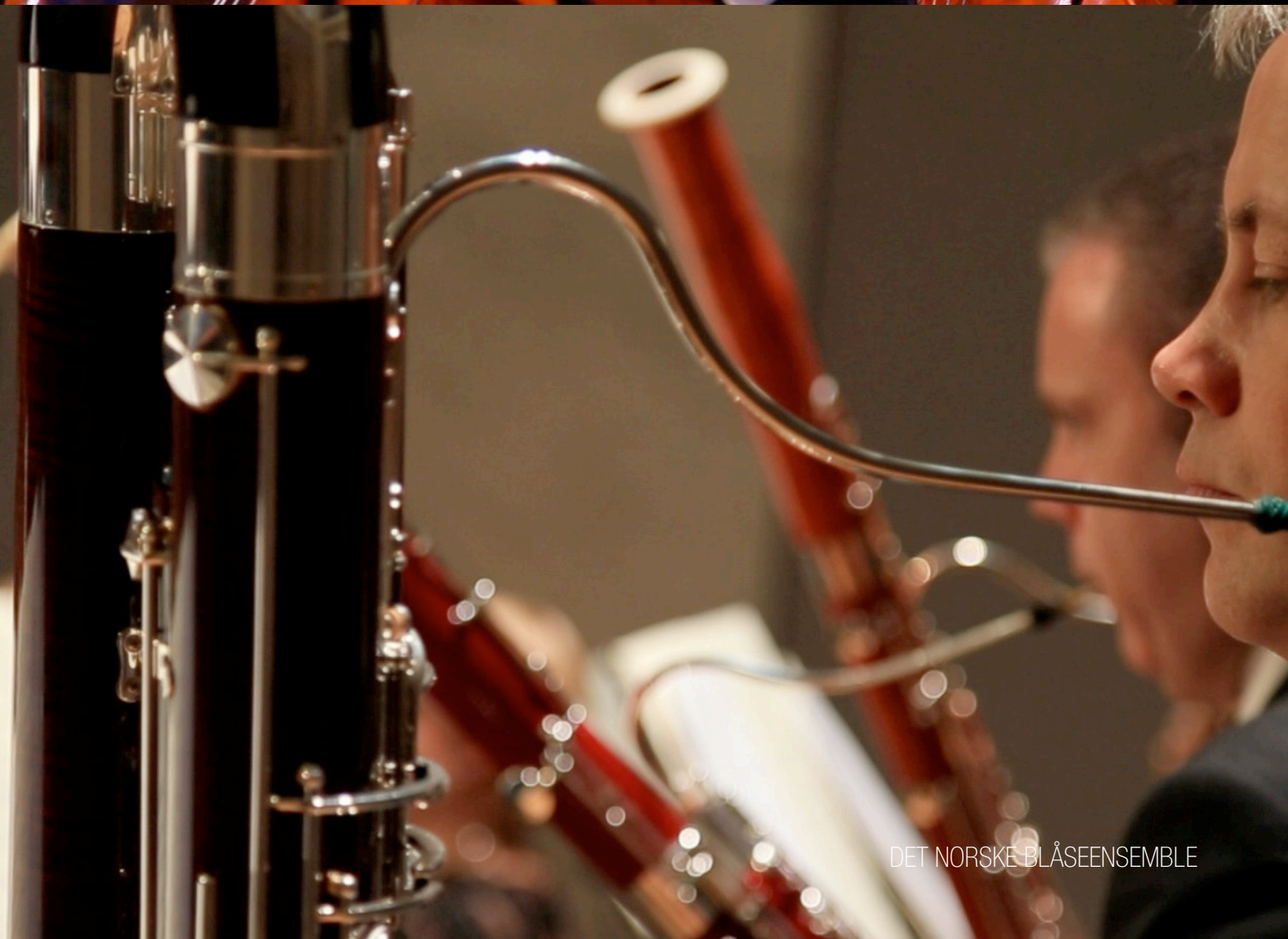
DET NORSKE BLÅSEENSEMBLE