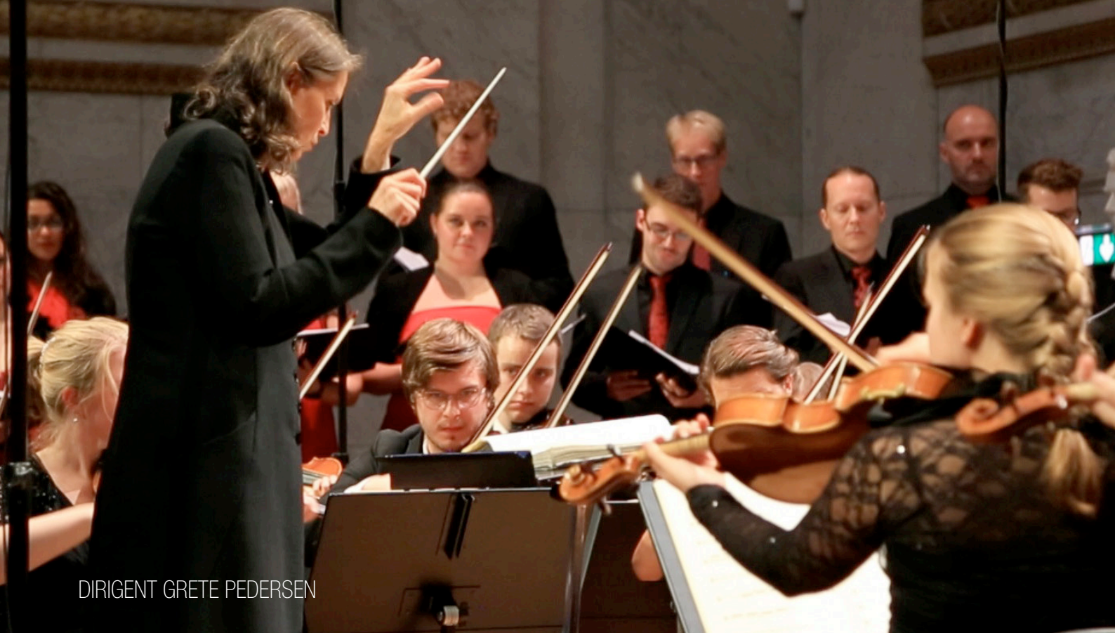
DIRIGENT GRETE PEDERSEN