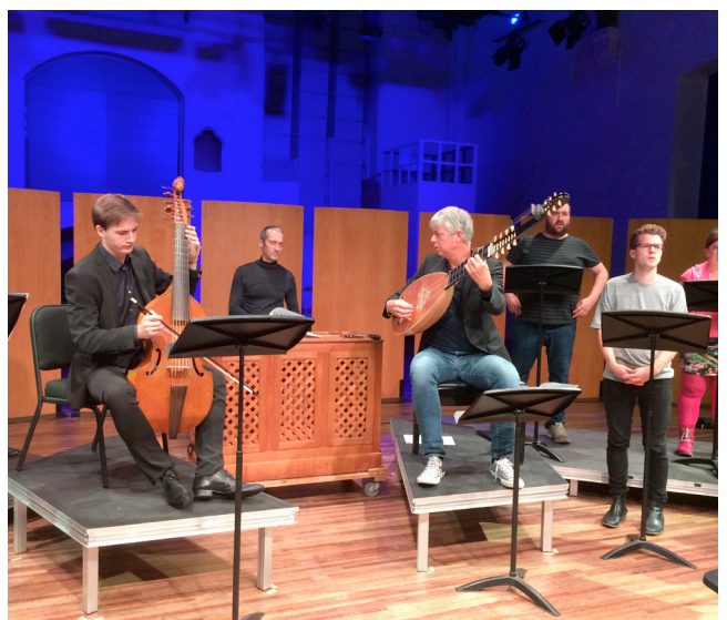
Øverst: Festspillene i Bergen. Foto: Thor Brødreskift I midten: Trondheim Kammermusikkfestival. Foto: Solistkoret Nederst: Turné i Belgia og Nederland. Foto: Solistkoret