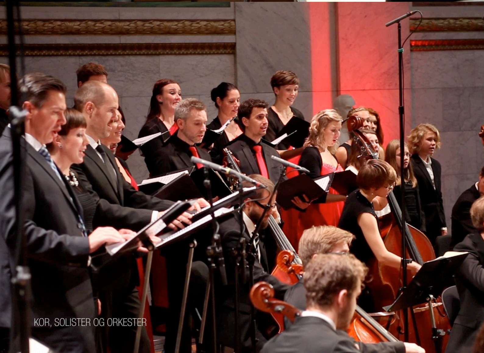
KOR, SOLISTER OG ORKESTER