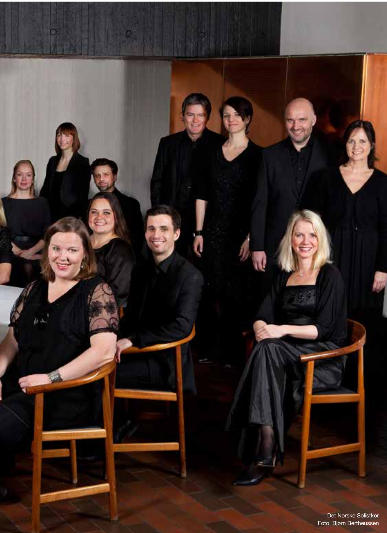
Det Norske Solistkor