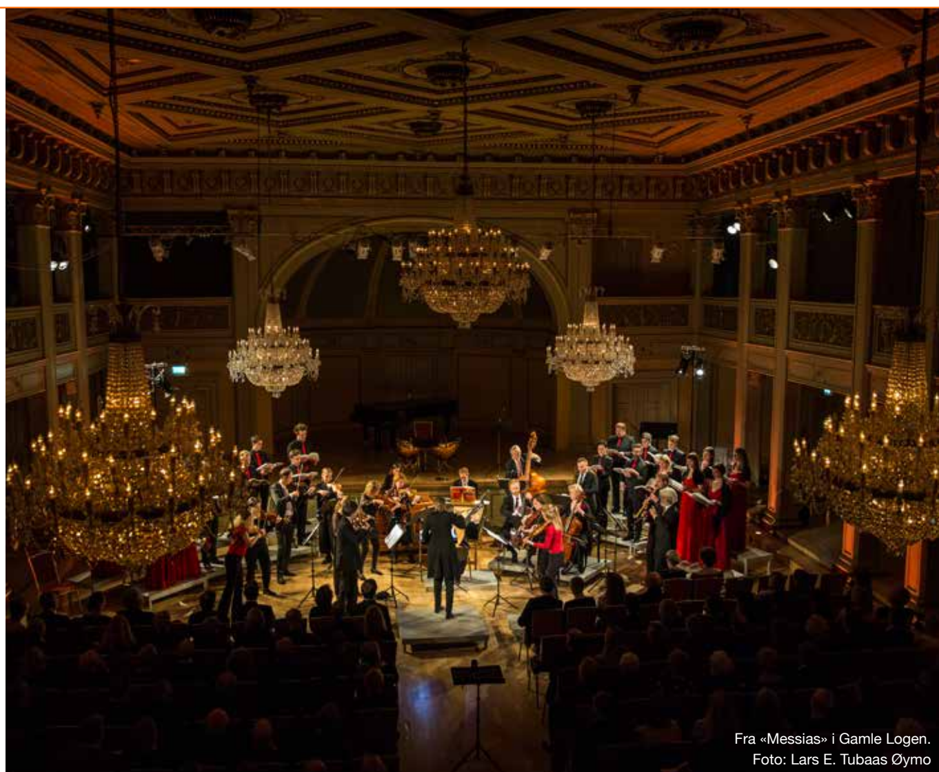
Fra «Messias» i Gamle Logen.