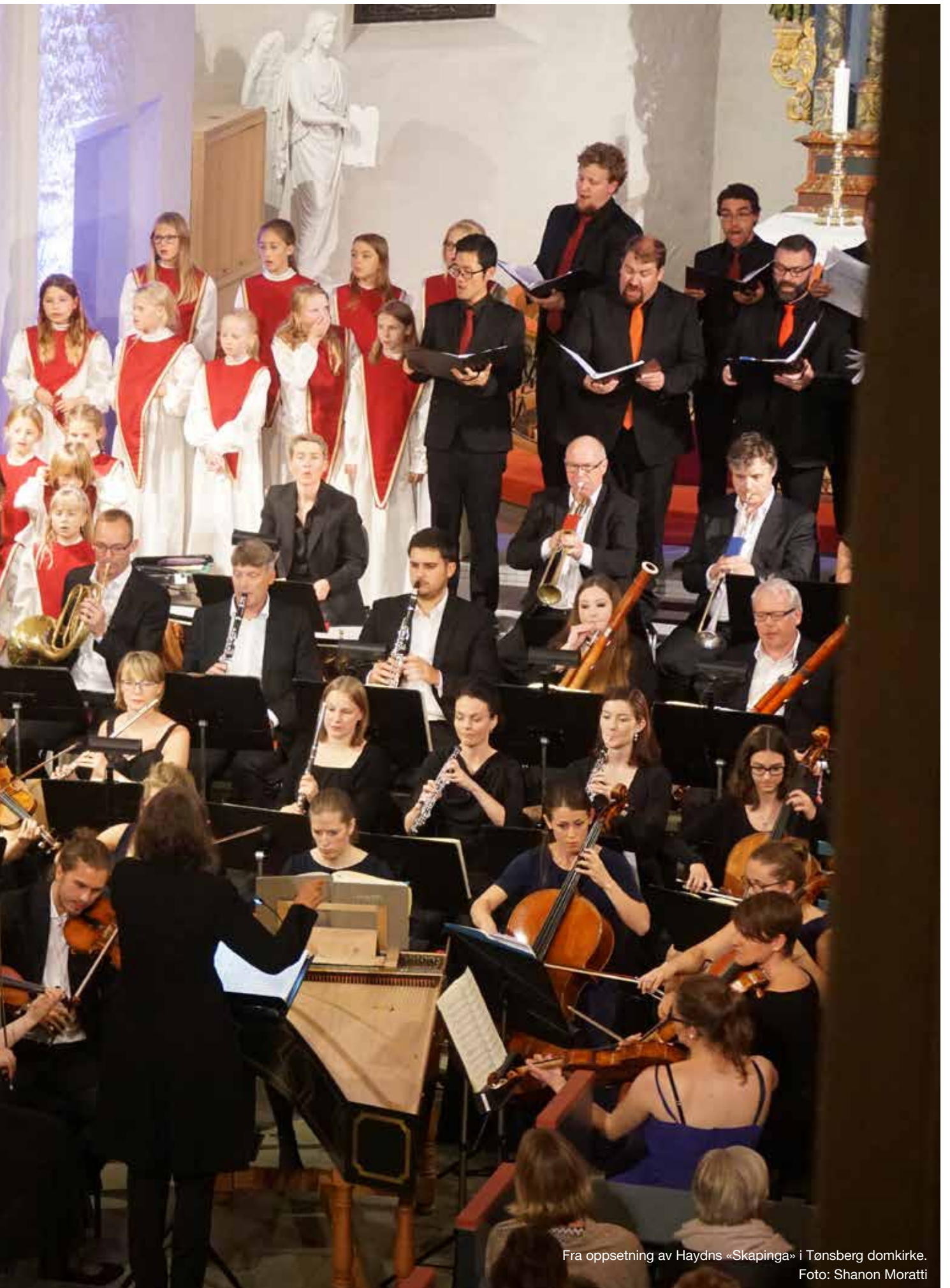
Fra oppsetning av Haydns «Skapinga» i Tønsberg domkirke.