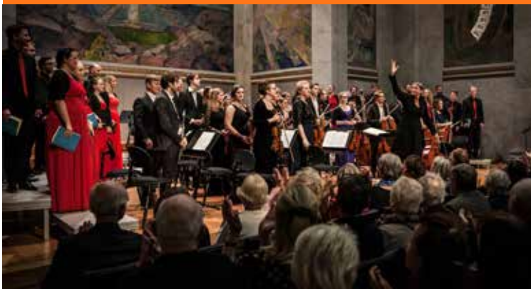
Allehelgenskonsert i Universitetets Aula.