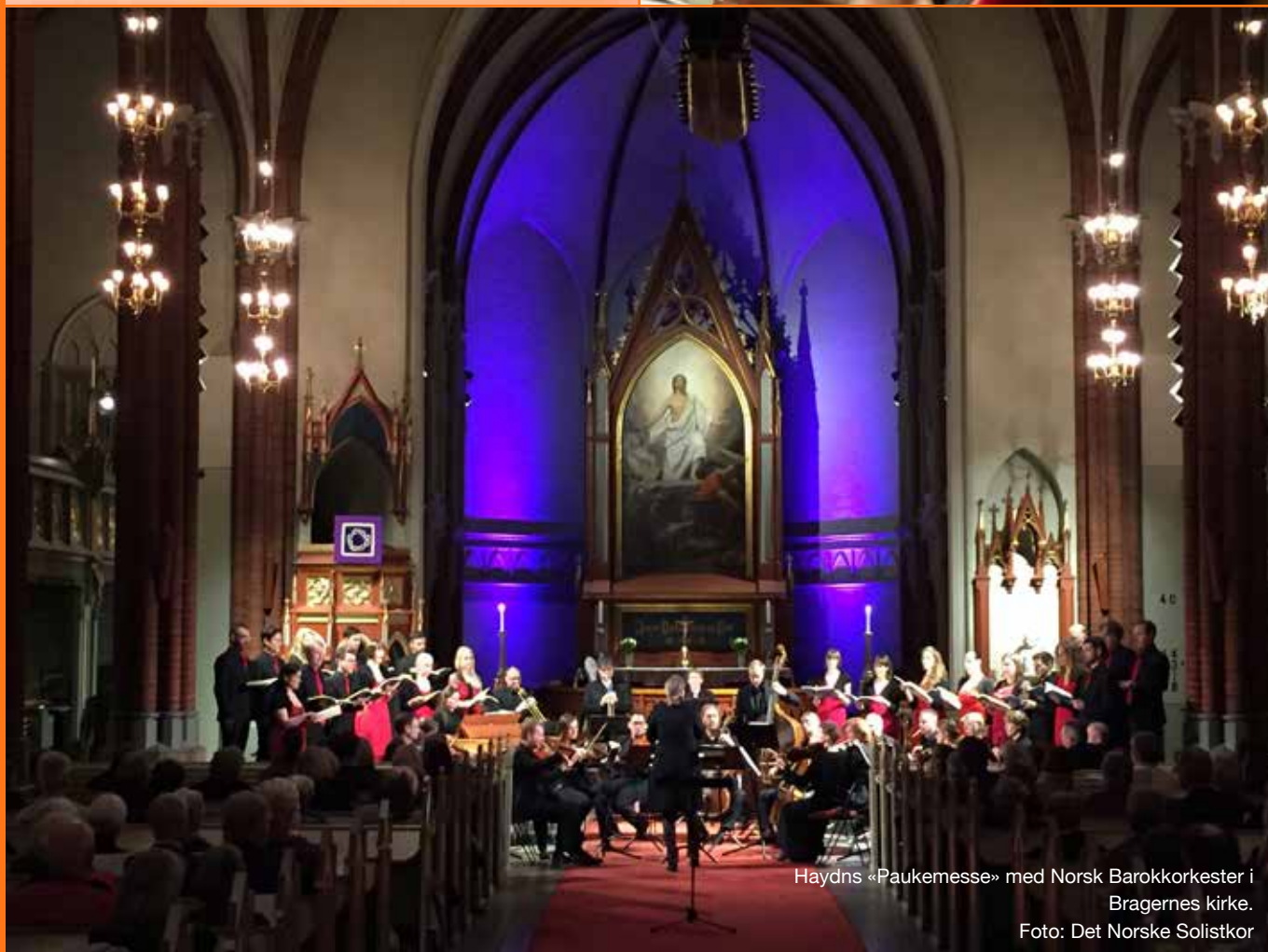
Haydns «Paukemesse» med Norsk Barokkorkester i Bragernes kirke.