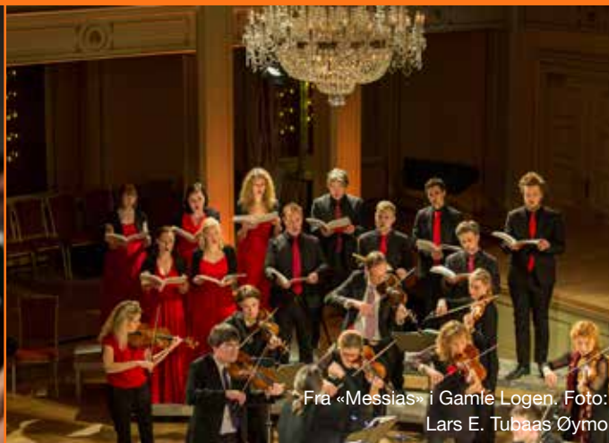
Fra «Messias» i Gamle Logen.