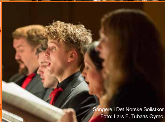
Sangere i Det Norske Solistkor.