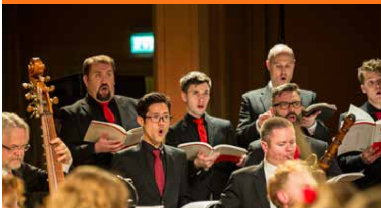
Messias i Gamle Logen.