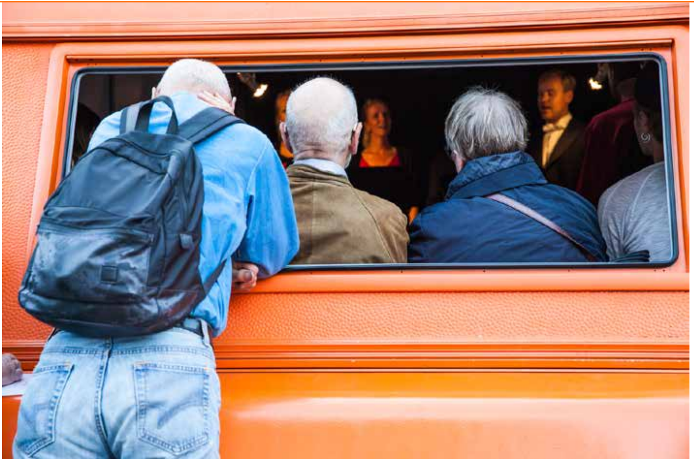
Et glimt inn i Jukebox under Oslo Kulturnatt.