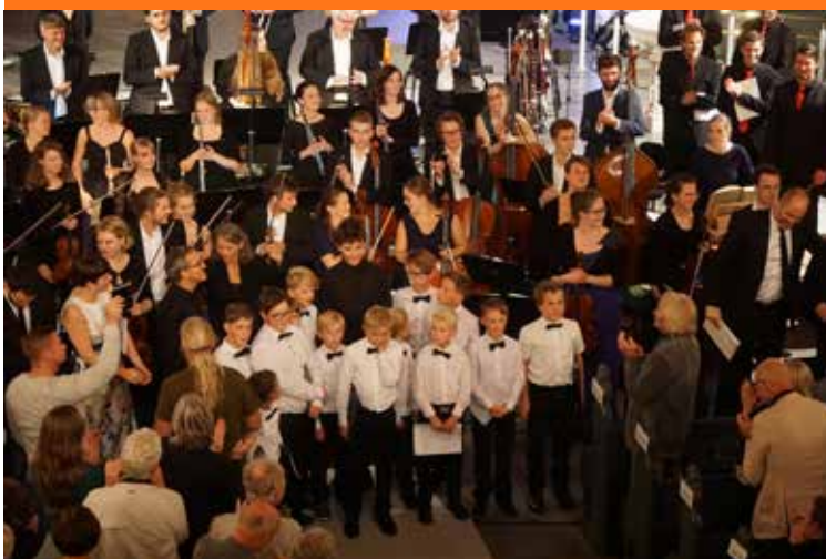
Skaping i Kr.sand domkirke.