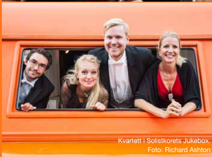
Kvartett i Solistkorets Jukebox.