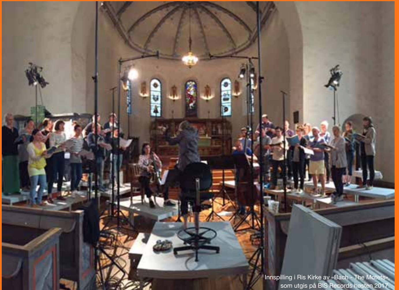
Innspilling i Ris Kirke av «Bach - The Motets», som utgis på BIS Records høsten 2017.