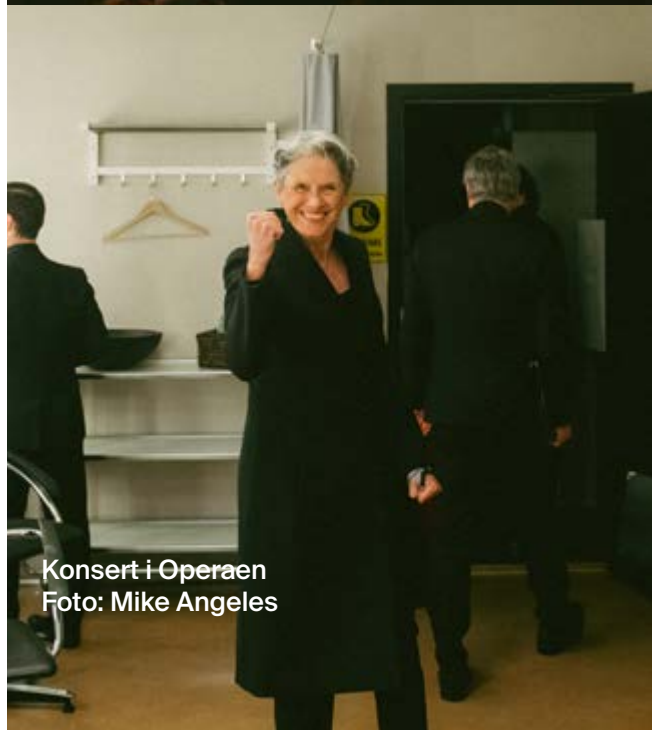
Konsert i Operaen