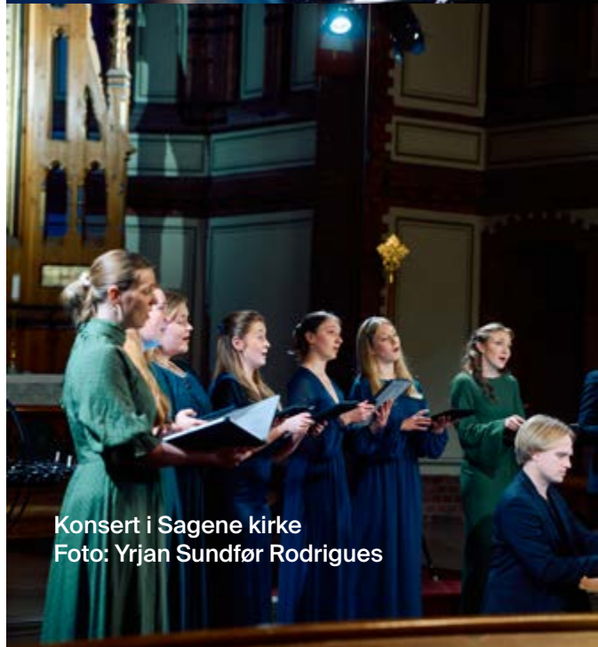
Konsert i Sagene kirke