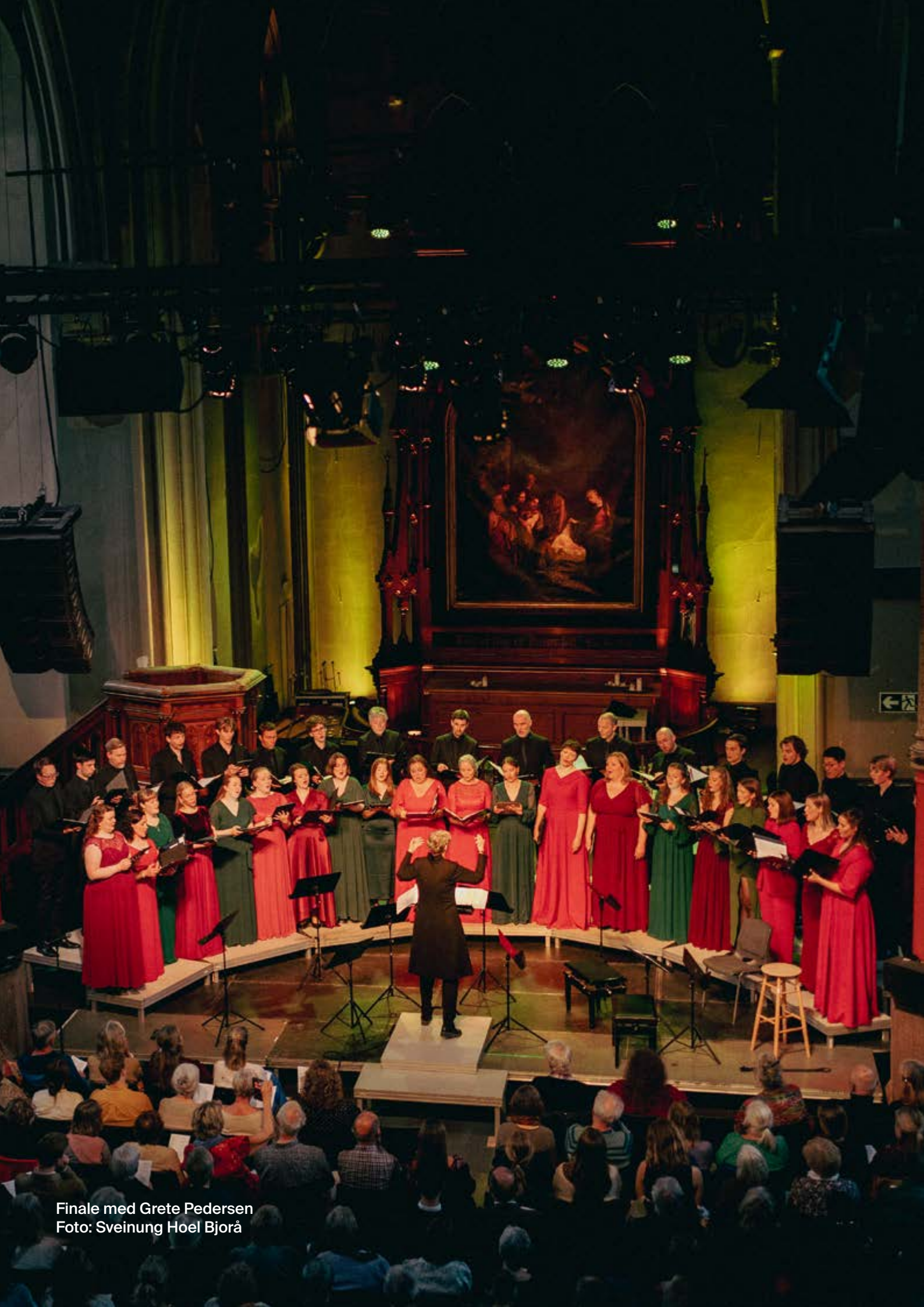
Finale med Grete Pedersen