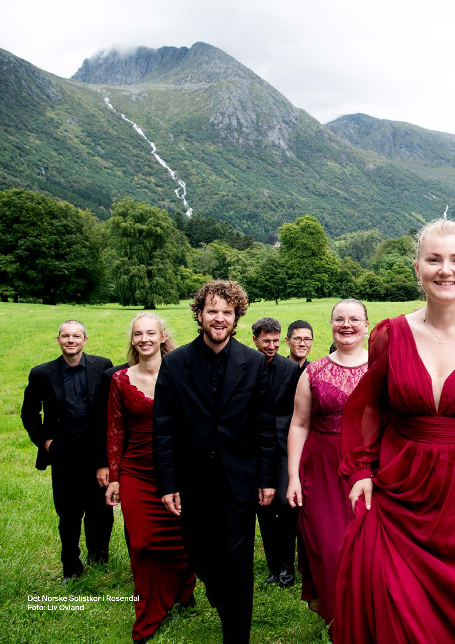
Det Norske Solistkor i Rosendal