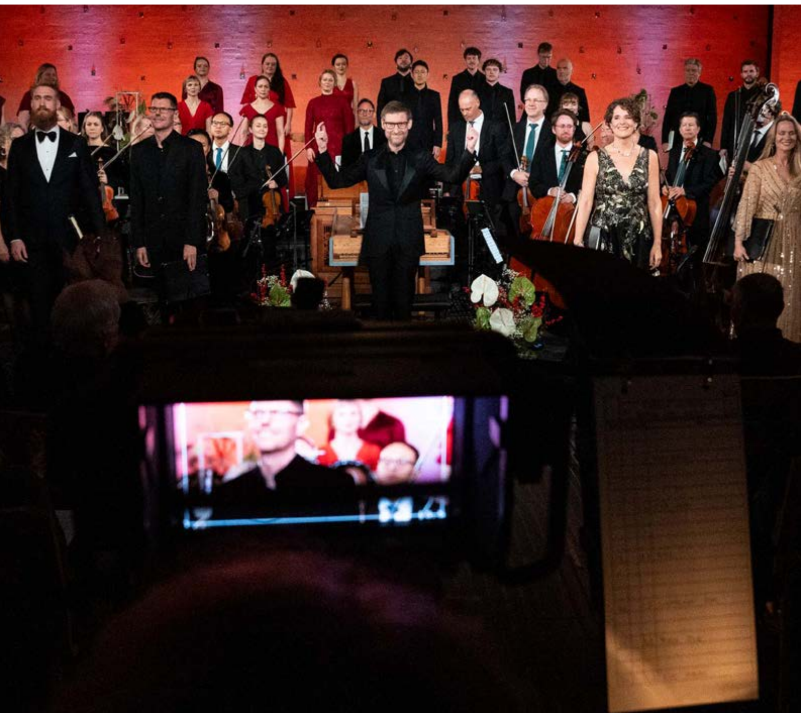
NRK gjorde opptak av Händels Messias i Lommedalen kirke

Det ble gjort TV- og radioopptak av konserten med Kork og Händels Messias i Lommedalen kirke. Hele konserten ble sendt på NRK2 21. desember, utdrag på NRK1 1. juledag. Konserten ble også sendt i NRK Klassisk. Solistkorets innspilling av nasjonalsangen ble vist på NRK 1 og TV2 etter H. M. Kongens nyttårstale.