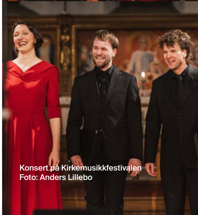
Konsert på Kirkemusikkfestivalen