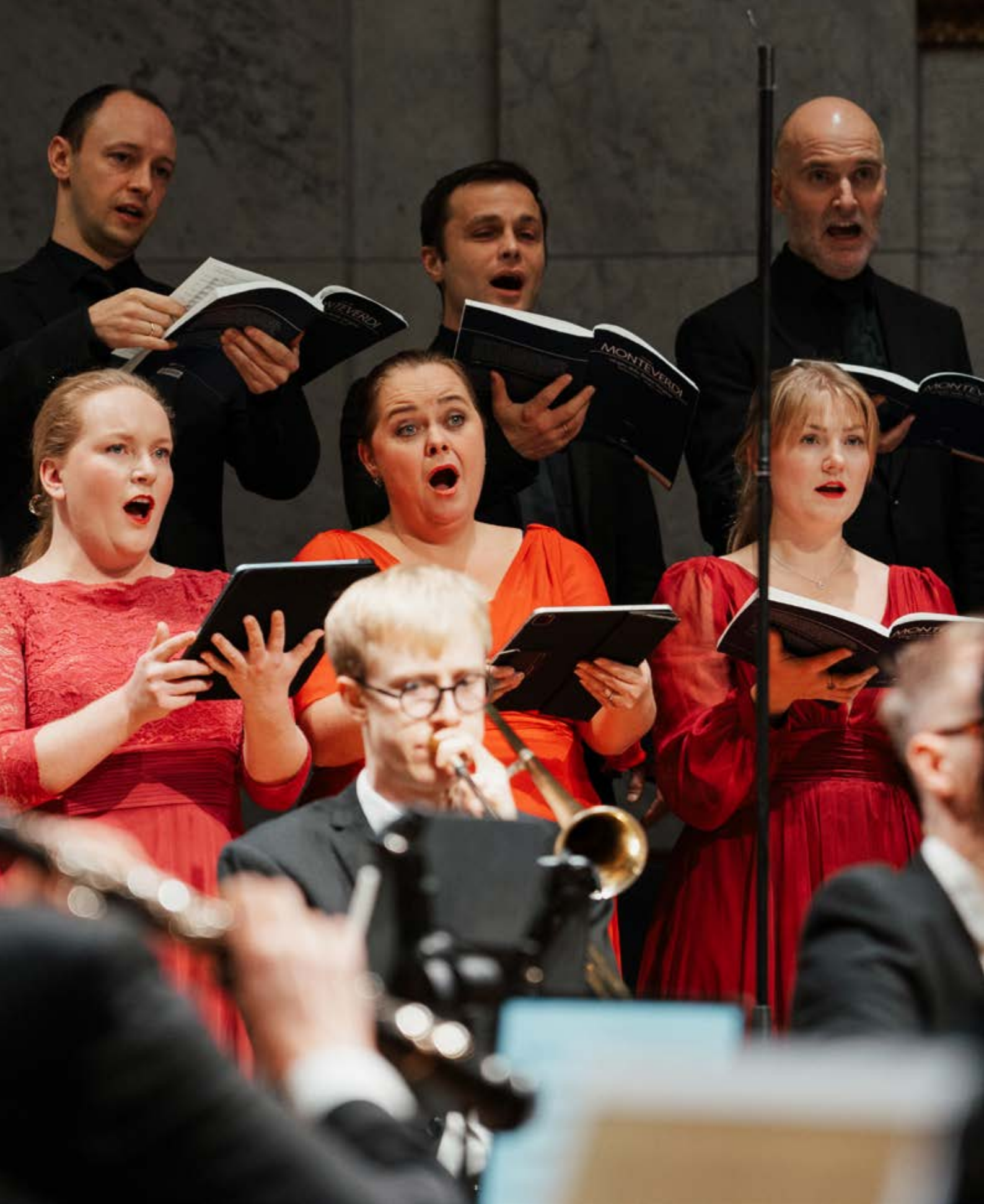
Konsert i Universitetets aula med Det Norske Blåseensemble